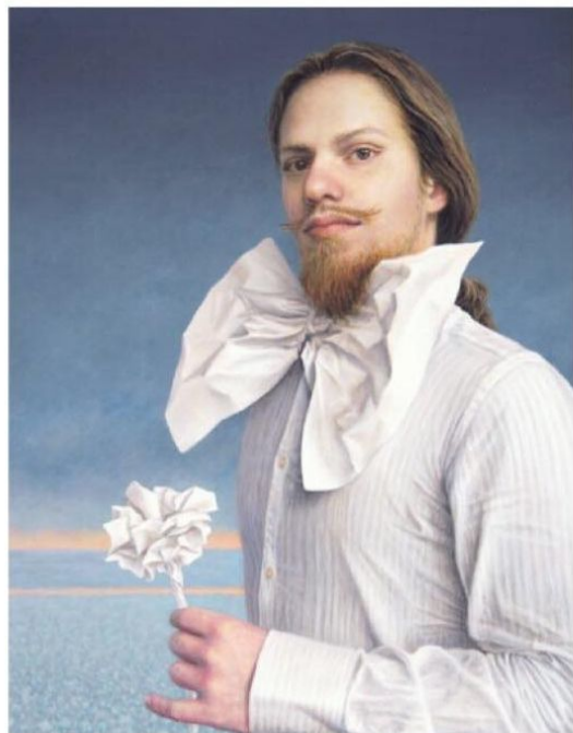
▲ Paper Garden van Sylvie Overheul, een magisch realistisch portret. ▼ De fysicus door Fulco de Vos, portret van dr. J.A. de Vos.